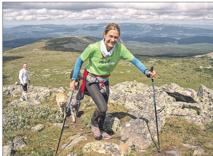
На ультрамарафоне подводятся итоги каждого этапа и дня. Также составляется рейтинг участников, которые осияли все старты. Место в нём зависит от результатов, сложности дистанции, набора высоты — в Свердловской области она суммарно превысит 4000 метров