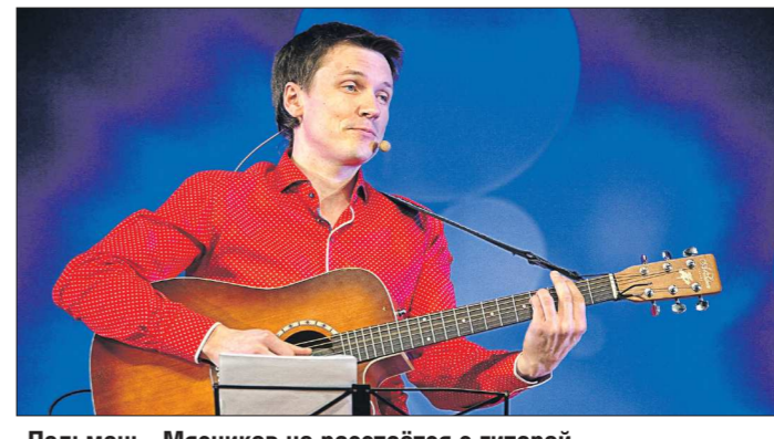
«Пельмень» Мясников не расстаётся с гитарой