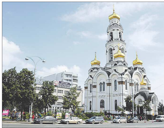
Центром фестиваля колокольного звона в Екатеринбурге стал храм Большой Златоуст, именно там проходят лекции и мастер-классы для звонарей

Интересно, что в гала-концерте фестиваля участие приняли не только звонари, но и танцующий военный оркестр «Уралбэнд», а также солисты Екатеринбургского театра оперы и балета, в