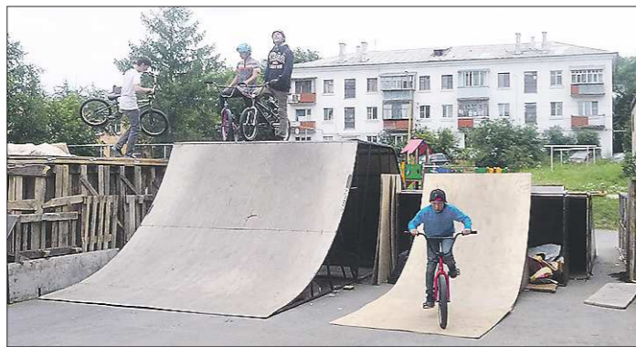
Самым сложным для ребят оказалось найти подходящие для фигур листы фанеры

Четыре года назад по программе «Тысяча дворов» в Заречном возвели скейт-парк и хоккейный корт рядом, потратив на это четыре с половиной миллиона рублей. Но за короткий срок парк полностью пришёл в негодность. Местные энтузиасты решили восстанавливать объект своими силами.