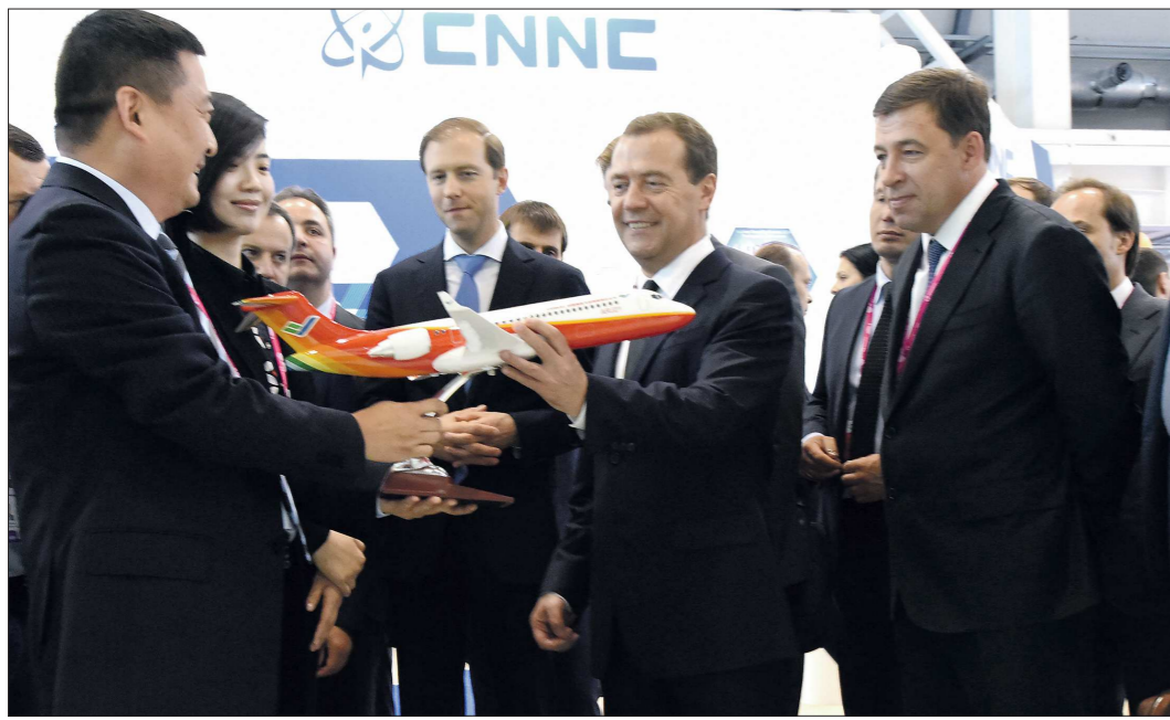
В подарок от Китайской корпорации коммерческих самолётов председатель правительства РФ получил модель пассажирского самолёта