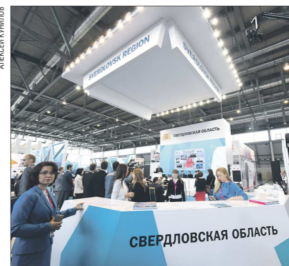
Главные достижения нашего региона представлены на стенде Свердловской области

чинаются здесь, имеют тенденцию к воплощению в жизнь не только на Урале, но