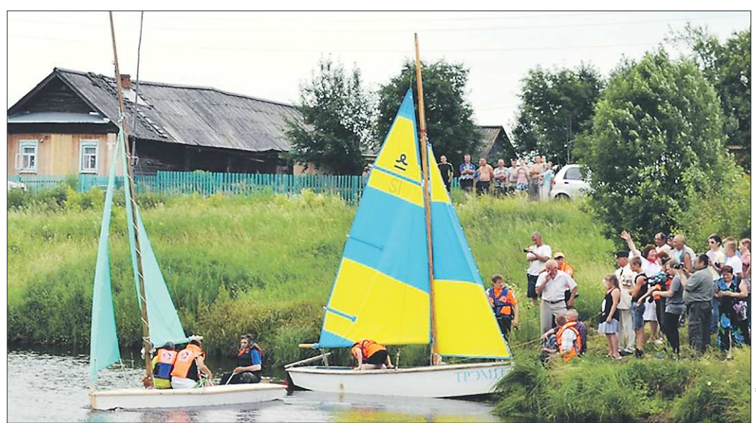
Маленькую школьную яхту в первом плавании поддерживала яхта нижнетагильского клуба «Парус»

Педагог по-своему обходит школьные кабинеты — с той же лёгкостью она находит ключи к великодушным спонсорам и меценатам