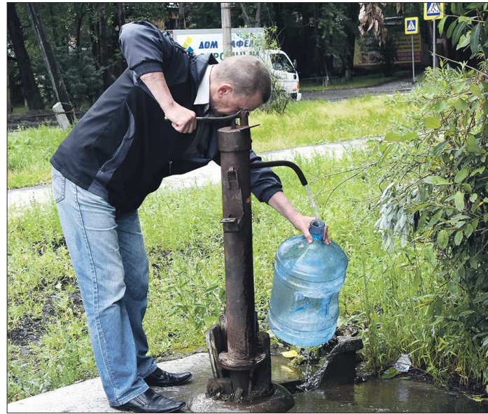
Иногда в бутылки разливают фильтрованную воду из системы центрального водоснабжения

— Наибольшее количество нарушений отмечено в образцах воды, расфасованной в оборотную тару (для кулеров). Наиболее частое нарушение — несо-