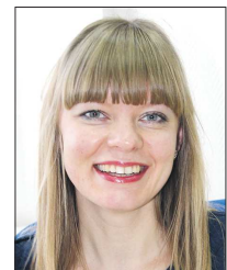
Контактная информация: г. Екатеринбург, ул. Грибоедова, 32/20. Тел.: (343) 2222339.

Компания имеет в собственности лицензированную скважину № 5567 глубиной 76 метров в Сысертском районе. Скважина расположена в лесном массиве и имеет три зоны санитарной охраны. Всё это позволило компании сертифицировать на соответствие международным стандартам безопасности производства пищевых продуктов.