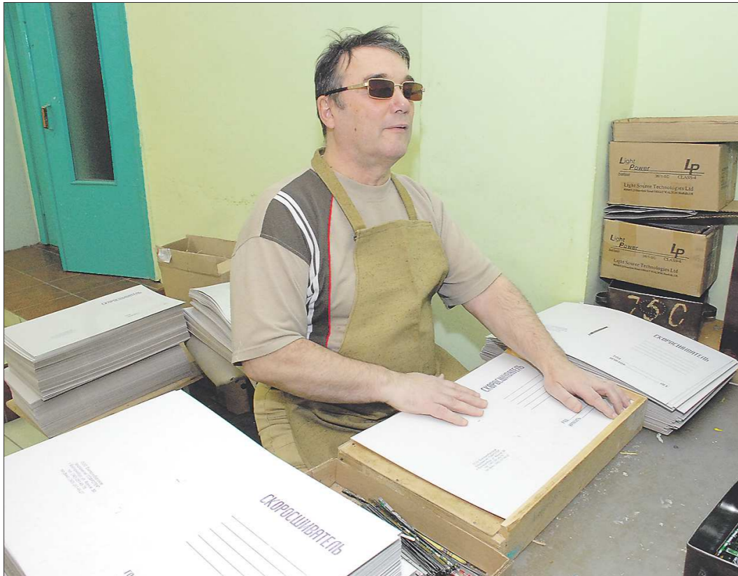
Долгие годы проблема обучения людей с ограниченными возможностями не решалась, и они были обречены на низкокачественную работу