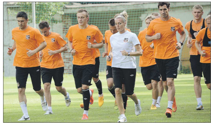
В предыдущее межсезонье уралцы отдыхали аж двадцать семь дней, а этим летом возобновили тренировки уже через две недели

Эталоном трудолюбия принято считать пчёл... «Шмели», как называют игроков нашей команды по имени клубного талисмана, дадут им фору. Уралцы изрядно потрудились, дабы не вылететь из «гнезда» премьер-лиги. По сумме двух стыковых матчей они переиграли томскую «Томь». Казалось бы: кто хорошо работает, тот хорошо отдыхает... Но екатеринбуржцы, затянув сезон аж до «переходников», сами урезали себе отпуск. 7 июня они провели заключительный матч, 22-го прошли обязательное углублённое медобследование и – пора на сборы.