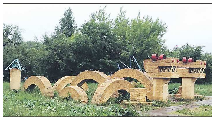
Многочисленные парковые преобразования не коснулись только кирпичного дракона, построенного ещё в советское время