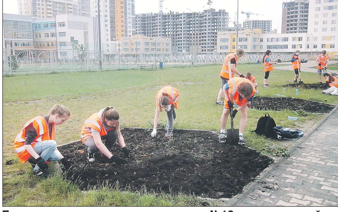
Подростки из трудового отряда школы №19 сделали родной Академический район (Екатеринбург) чище и красивее, а заодно заработали на карманные расходы

Не только отдохнуть, но и заработать стремятся многие школьники в летние месяцы. Возможностей для этого много: одни идут в лагерь труда и отдыха, другие обращаются в службы занятости, а третьи предпочитают устраиваться в офисы или в заведения общепита самостоятельно. Сколько получают несовершеннолетние сотрудники и какие условия необходимо соблюдать работодателям — разбирались «ОГ».