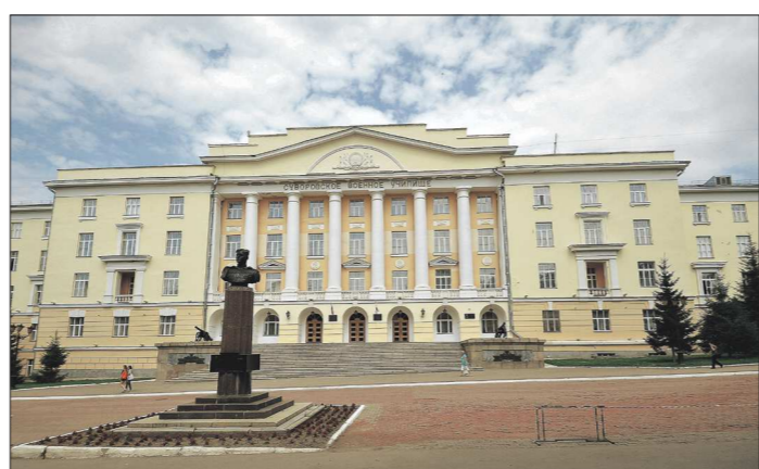
Суворовское училище – яркий пример архитектурного стиля неоклассицизма второй половины 30-х годов XX века

Окончательные решены и споры вокруг расчётов ресурсов, потраченных на общедомовые нужды: будут учитываться лишь реальные расходы – за неотопляемые чердаки и неосвещаемые подвалы платить будет не нужно.