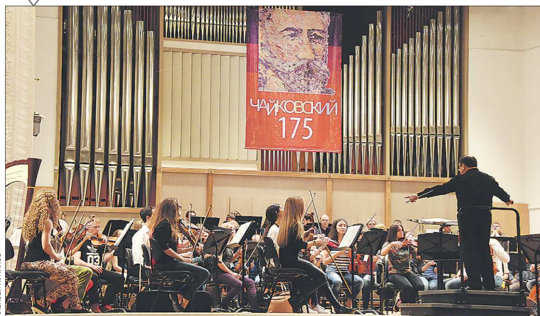
Перед открытием фестиваля участники несколько часов репетировали на сцене Свердловской филармонии

Вчера в Екатеринбурге стартовал III фестиваль Чайковского. В этом году исполняется 175 лет со дня рождения композитора, так что мероприятия пройдут с особым размахом. С 26 июня по 12 июля в стенах Свердловской филармонии состоится семь фестивальных вечеров. «ОГ» подготовила список наиболее интересных событий фестиваля, главное из которых — опера-концерт «Евгений Онегин» в авторской трактовке Юрия Башмета. Чтецом выступит народный артист России Сергей Безруков.