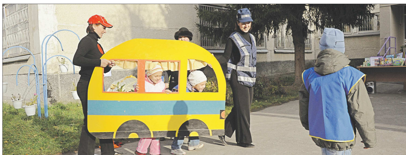
Малышам должно быть хорошо не только в игровом автобусе, но и в настоящем. Эту задачу поможет решить новый закон

Такого существенного увеличения количества рабочих мест удалось добиться в том числе благодаря системе мер господдержки, которая работает в регионе. Прежде всего господдержку получают организации, имеющие статус участников приоритетного инвестиционного проекта Свердловской области по новому строительству, модернизации, реконструкции и техническому перевооружению объектов основных фондов, приводящего к значимым для области социально-экономическим эффектам. Прямую финансовую поддержку получают также отдельные категории хозяйствующих субъектов агропромышленного комплекса, жилищно-коммунального хозяйства, транспорта, энергетики и других в рамках государственных программ Свердловской области. Кроме того, в области действует программа поддержки системы инфраструктурного обеспечения процесса создания и модернизации рабочих мест, помощь при подготовке (переподготовке) кадров для новых и модернизируемых рабочих мест. А поддержка создания и модернизации рабочих мест в социальной сфере осуществляется через прямое финансирование в рамках государственных программ Свердловской области и муниципальных программ.