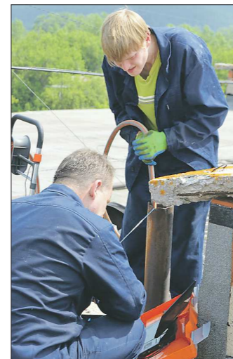
Сысертские сантехники будут выходить в рейды каждую неделю и устанавливать в среднем по шесть заглушек за смену

В Екатеринбурге этот метод борьбы с должниками практикуют уже давно. 6 сентября 2012 года «ОГ» описывала связанный с этим курьёз. Пытаясь снять с канализации заглушку, екатеринбургские должники проткнули её из квартирного канализационного отвода в общий стояк. Но сделали это неудачно: закупорили трубу наглухо. В итоге все стоки из верхних квартир стали поступать к неплательщикам, причём квартиры соседей тоже серьёзно пострадали. Пришлось вызывать сантехников-профессионалов. Аварийная бригада МУП «СУЭРЖ» освободила коллективный стояк и вернула заглушку на место.