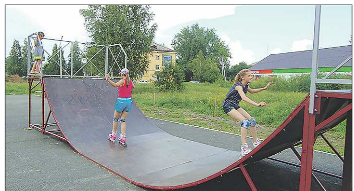
Свободчанам пока не даются фигуры «высшего пилотажа», но на роликах и велосипедах они держатся вполне уверенно

Вчера вечером, во время сдачи номера, в Екатеринбурге разразилась сильнейшая гроза с ливнем. Возможно, кому-то вновь пришлось добираться домой влывав