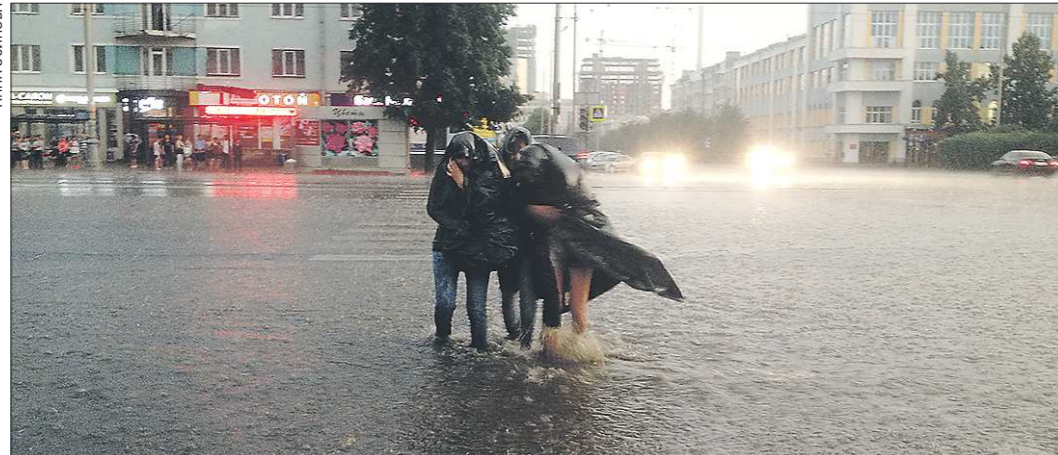
Из-за грозы и ливня, обрушившихся на Екатеринбург, улицы превратились в реки. Транспорт буксовал. Горожане брели по улицам почти по колено в воде

Сейчас по Среднему Уралу проходит атмосферный фронт, который создаёт высокую опасность осадков. 25 июня ожидается, что температура