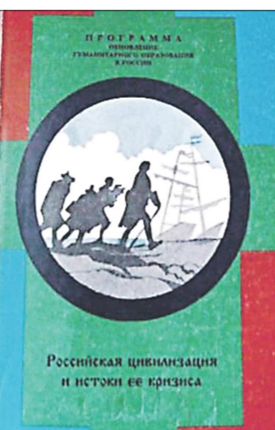
Учебник Иконова, изданный на деньги Сороса, больше не могут использовать в российских школах

После провозглашённого в 90-х годах плюрализма число учебников истории в России к началу 2000-х годов достигло... 1 200. Нам, окончившим среднюю школу на излёте перестройки, такое количество взглядов на события в стране кажется просто непостижимым. Но это факт. Многообразие мнений дошло до того, что одни учебники винили СССР в развязывании Второй мировой войны. Другие, изданные на деньги американского «благотворителя» Сороса, воспеивали в российских детях чувство национальной неполноценности, убеждая их в заведомо ошибочных установках российской цивилизации,