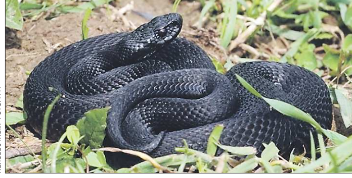
Жители Каменского ГО беспокоены нашестем гадюк. В деревнях стали всё чаще замечать их рядом с жилыми домами.

и пряники. Здание молочной кухни стоит с пустыми глазами окон. История талицкий Елани ещё причудливее.