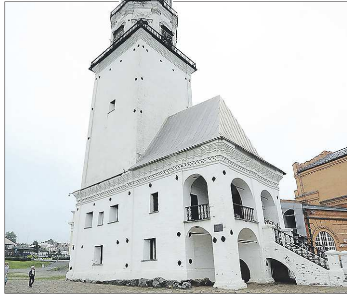
Невьянская башня сегодня — один из самых посещаемых туристических объектов в области

лагуна» оценивается в полтора миллиарда рублей, но большую часть средств планируется привлечь за счёт частных инвесторов.