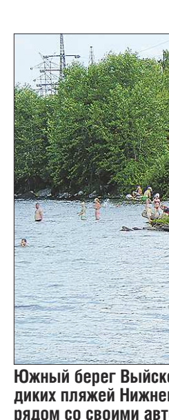
Южный берег Вейгского пруда — один из самых многолюдных диких пляжей Нижнего Тагила.

Поскольку ни одна из прибрежных зон пляжем не является, у городских чиновников проблем стало меньше: не нужно создавать на берегах условия для безопасного отдыха.