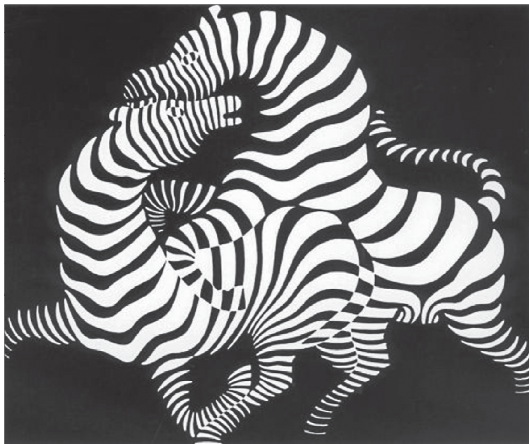
«Бегающие зебры». 1944-1947. Кстати, серию «Зебры» художник начал ещё в 1932 году. Серия не отпускала его на протяжении всей жизни. В основном зебры чёрно-белые на белом или чёрном фоне, но есть и цветные работы