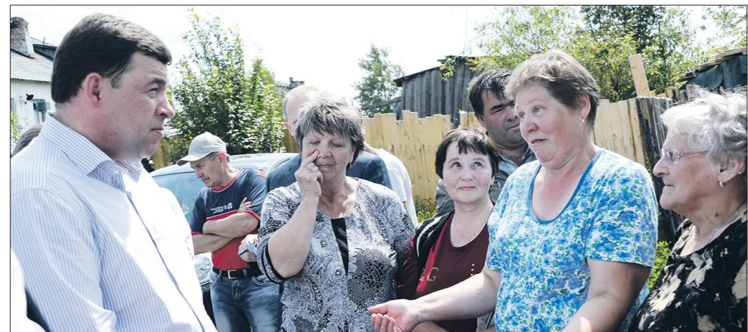
Жители частного сектора возмущены тем, что из-за большой стройки их дома затопливает водой. Евгений Куйвашев поручил местным властям решить проблему

Ещё одна стройплощадка — будущий детский сад — не могла не порадовать гостей: са-