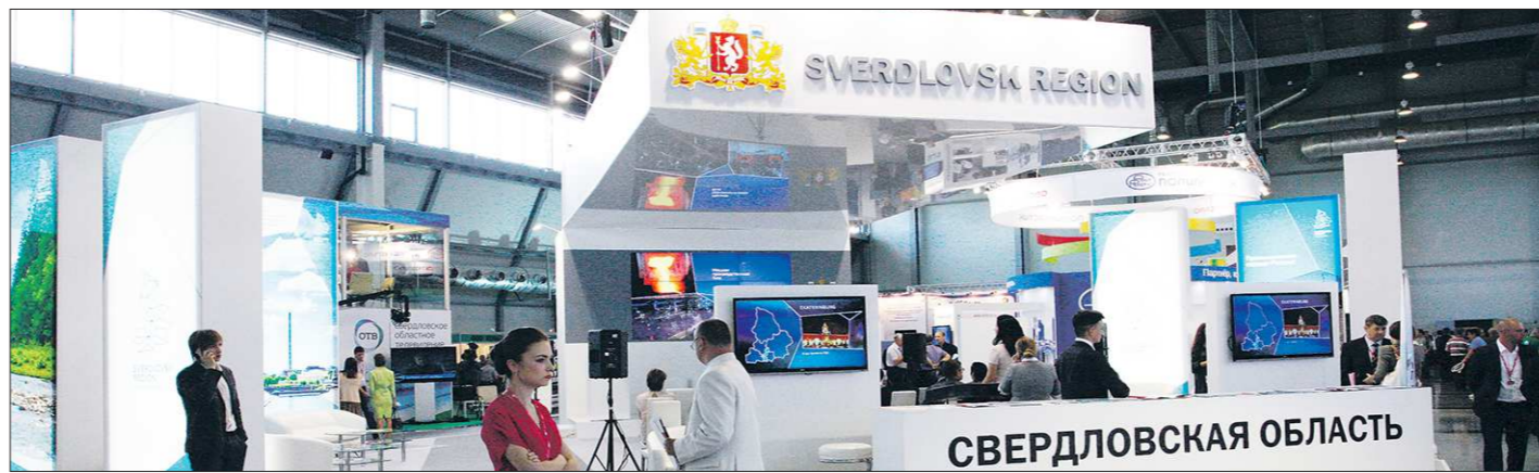
Стенд Свердловской области на выставке 2014 года посетители вниманием не обделили. В региональном оргкомитете уверены, что и на Иннопроме-2015 Средний Урал будет представлен достойно

Готовящимися сейчас поправками к областному бюджету предусмотрено увеличение на 1,2 миллиарда рублей ассигнований на нужды сельского хозяйства. В частности, 172 миллиона рублей будут дополнительно выделены сельхозпредприятиям, специализирующимся на производстве молока.