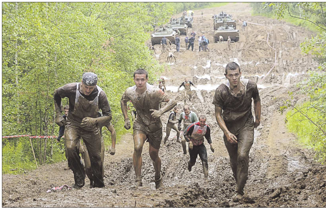
Для лучшего антуража организаторы обильно полили трассу водой, наделили грязью, задействовали 18 единиц военной техники и потратили более 10 000 холостых боеприпасов

Нашу команду (или, как тут говорят, взвод) приглашают на старт «Ненависть!» Так мы, оказывается, зовёмся. А с виду – милые ребята: шестнадцать парней и четыре девушки. Два инструктора – открывающий и замыкающий. Откуда же и к чему эта ненависть? К препятствиям, воде, грязи? Для меня-то главная проблема – высота. Жутко боюсь! И первая же точка на трассе, как по заказу, – четырёхметровый