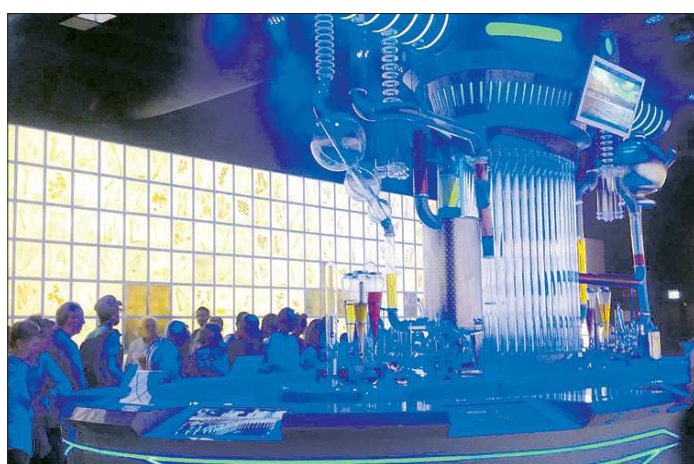
В павильоне России на Всемирной универсальной выставке, в зоне Водного бара-лаборатории, можно отведать не только популярные национальные напитки — морс и квас, но и попробовать российские вина. Всего российскую экспозицию в Милане уже посетило более 528 тысяч человек