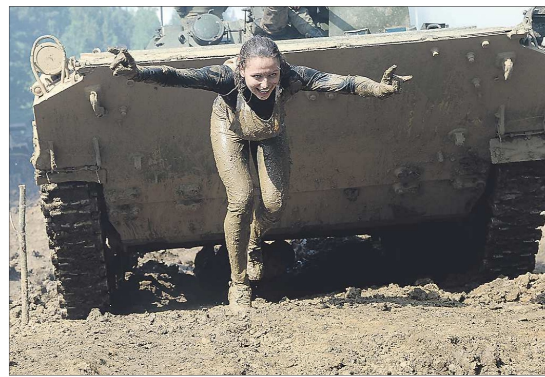
«Трасса у вас — самая жуткая из всех городов»

Екатеринбург впервые принял старты военно-спортивной игры «Гонка героев». Соревнования, которые призваны возродить нормы ГТО, прошли на полигоне «Свердловский». За два дня, 13 и 14 июня, экстремальный кросс с препятствиями собрал более 2 000 участников. «Герои» соревновались в гравии, лужах, под дождём и холостыми выстрелами техники, состоящей на вооружении Центрального военного округа (ЦВО). В награду за переживания экстремальщики получили... горячий душ, гречневую кашу, баранки и чай с полевой кухни. А ещё — жетоны участников проекта «Гонка героев». Всю трассу семиклометрового гонки преодолела и сотрудница «ОГ»