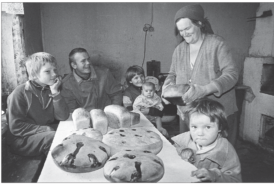
Деревенское «пирожное» – хлеб с конфетками. Снимок сделан в 1998 году на станции «Михайловский завод»

– Первым удачным кадром у вас стал снимок лю-