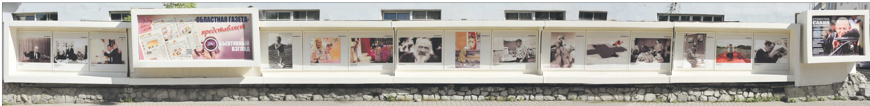
Снимки Станислава Савина можно наблюдать на выставке у Главпочтамта в течение ближайшего месяца... Или в любой день на сайте «ОГ» www.oblgazeta.ru