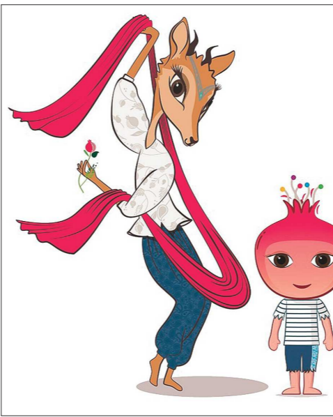
Талисманы Игр – газель Джейран и гранат Нар

Это, уверен, будет большой праздник спорта, хотя МОК ещё и предстоит думать, как вписать его на будущее и в без того насыщенный график турниров. Может быть, стоит отменить чемпионаты мира по некоторым видам спорта в этот год. В любом случае нужен серьёзный разговор о календаре.