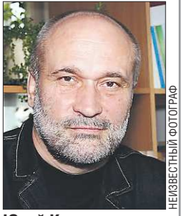
Юрий Казарин – автор 13 поэтических сборников и 20 монографий и учебных пособий

А для журнала «Урал», да и всего нашего региона, – большая честь, что ты у нас есть, что ты здесь работаешь. Творческих тебе пожеланий с днём рождения!