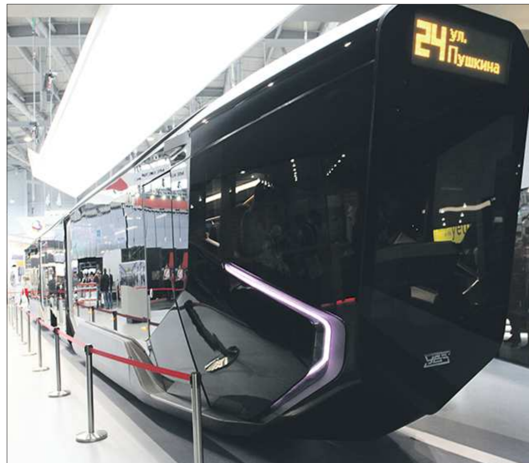
Возможно, именно такие трамваи будут курсировать между Екатеринбургом и Верхней Пышмой

По мнению губернатора, самым логичным сегодня было бы создать ассоциацию городов-спутников. Этот способ, как самый демократичный, не требует быстрого объединения территорий, когда необходимо ломать всю систему координат. Главное — создать систему соглашений между городами-спутниками, на которой и будет проходить объединение. Контролировать ра-