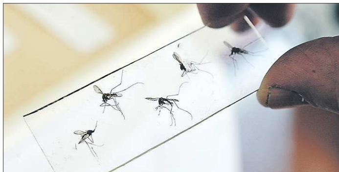
Изобилие комаров в Свердловской области отмечается второй год подряд

Учёные подтверждают, что в этом году комаров на Урале, действительно, в разы больше обычного. Причина появления большого количества кровососущих кроется в погодных условиях. Благоприятствует сочетание высокой температуры воздуха и повышенной влажности. Личинки комаров развиваются во влажных местах: