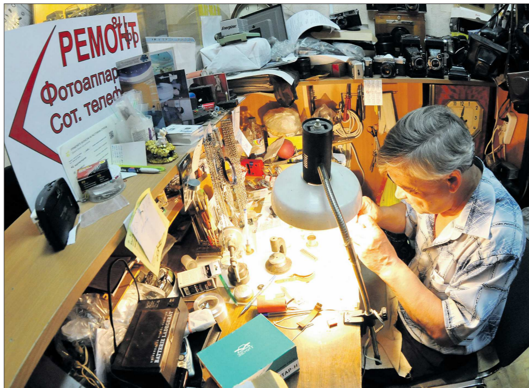
Услуги по ремонту различной аппаратуры, как и многие другие, можно предоставлять по патенту

Патент — удобный вид налога для малого предпринимателя. Купил его, и являешься в налоговой больше не надо. Ни деклараций, ни дополнительных налогов (патент заменяет налог на добавленную стоимость (НДС), на доходы физических лиц (НДФЛ), на имущество). Нет необходимости в бухгалтерском учёте и контрольно-кассовом оборудовании. Расчёт суммы налога местным налоговым органом производится на определённый срок (от одного месяца до года) по 47 видам деятельности, получить патент можно всего за пять дней. Ставка одинакова — шесть процентов, потенциально возможный доход — разный. На сайте Федеральной налоговой службы nalog.ru ясно изложена информация, как и на каких условиях можно оформить патент. Здесь же вы можете рассчитать его стоимость. Например, патент на парикмахерские услуги на шесть месяцев стоит 6 750 рублей. Представим себя индивидуальным предпринимателем: в среднем за 20 рабо-