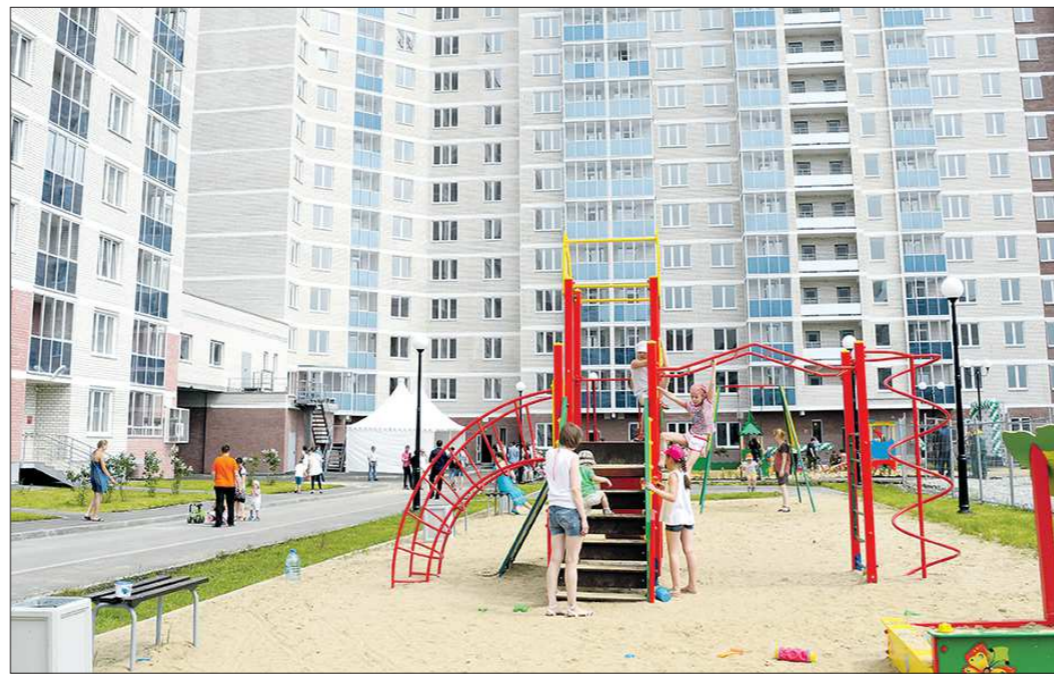
В двух очередях дома на Хрустальноречка будет 14 тысяч квадратных метров. 10 тысяч из них передадут обманутым дольщикам