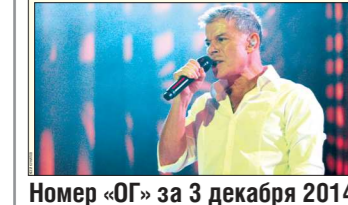
Номер «ОГ» за 3 декабря 2014 года