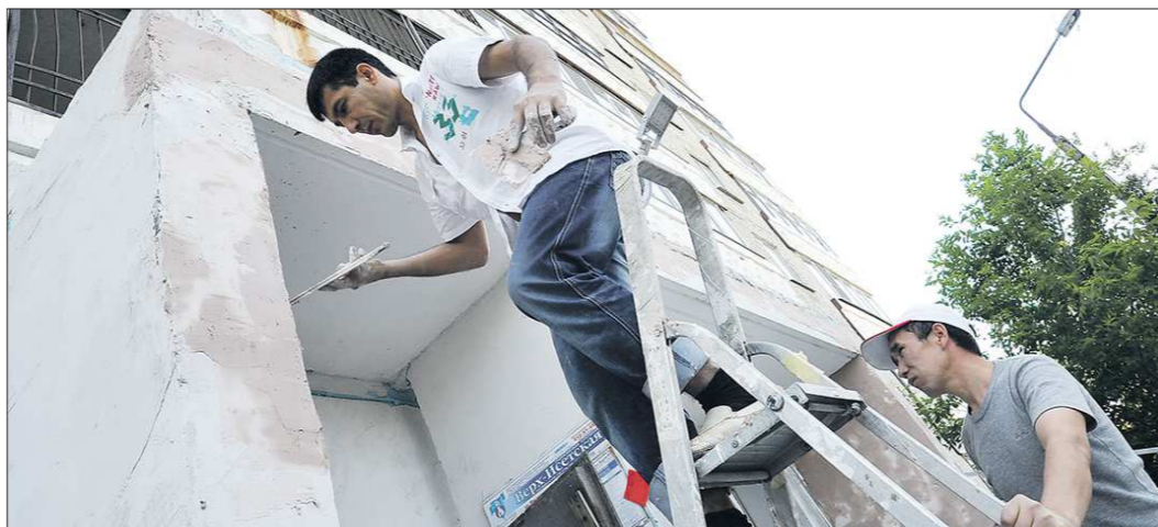
Минимальный взнос на капремонт — 8,2 рубля с квадратного метра. Граждане, желая провести более качественный ремонт, могут на общем собрании принять решение об увеличении суммы