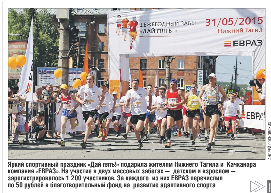
Яркий спортивный праздник «Дай пять!» подарила жителям Нижнего Тагила и Качканара компания «ЕВРАЗ». На участие в двух массовых забегах — детском и взрослом — зарегистрировалось 1 200 участников. За каждого из них ЕВРАЗ перечислил по 50 рублей в благотворительный фонд на развитие адаптивного спорта

Послесловие (из серии «повторение пройденного»). Все книжки передвижного библиотечного фонда я возвращал в целости и сохранности. А спустя годы, будучи руководителем кружка юных переплётчиков при станции юных техников, выполнял заявки центральной городской библиотеки Сухого Лога на восстановление потрёпанных экземпляров. И кружковцы, научившись переклеивать разорванные форзацы и корешки учебников, стали бережливее относиться к любой книжке: библиотечной или домашней.