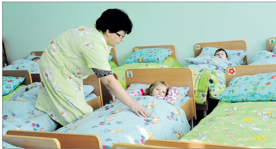
В 2016 году каждый юный свердловчанин в возрасте от трёх до семи лет гарантированно получит место в детсаду

«За нынешний год мы должны обеспечить местами в детсадах всех ребятишек в возрасте от трёх до семи лет. К тем должностным лицам, которые допускают срыв сроков строительства новых детсадов, будут приняты самые решительные меры», — сказал вчера, 1 июня, губернатор Евгений Куйвашев на заседании президиума правительства Свердловской области, посвящённом вопросам демографической политики.