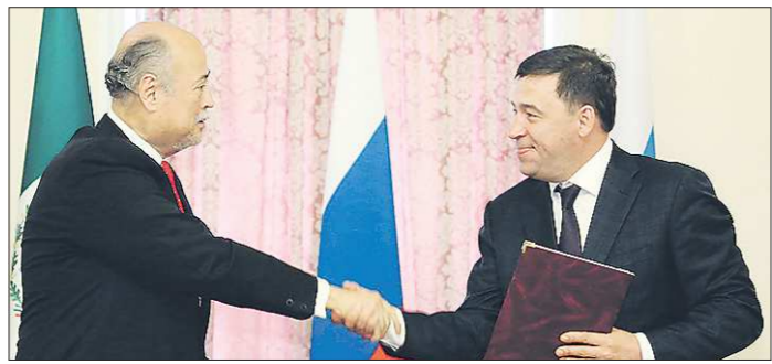
Подписанный вчера Рубеном Бельтраном и Евгением Куйвашевым протокол предусматривает развитие экономических, образовательных, культурных и туристических связей

Вчера, 1 июня, губернатор Евгений Куйвашев и Чрезвычайный и Полномочный Посол Мексики в России Рубен Альберто Бельтран Герреро подписали протокол о расширении сотрудничества и дали старт Дням Мексики на Среднем Урале.