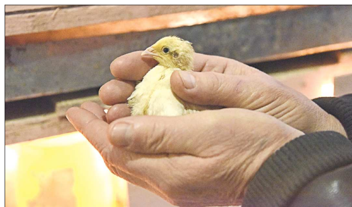
Разведение перепелок не даёт быстрого оборота, но такое производство тоже нужно развивать

– Мы не должны упускать из виду существующие ограничения и диспропорции, сдерживающие развитие предпринимательства в Свердловской области. Во-первых, это территориальная диспропорция. Сегодня подавляющее число субъектов малого и среднего бизнеса сосредоточено в крупных городах. Во-вторых, это отраслевая диспропорция – явный крен в сторону быстрого оборота капитала, то есть торговли и сферы услуг. В-третьих – структурная диспропорция – небольшое количество средних предприятий. Но именно средние предприятия наиболее эффективны и создают максимальную добавленную стоимость. Особо остро стоит вопрос доступности финансовых ресурсов для малого и среднего бизнеса. Среди мер, которые предусматривает но-