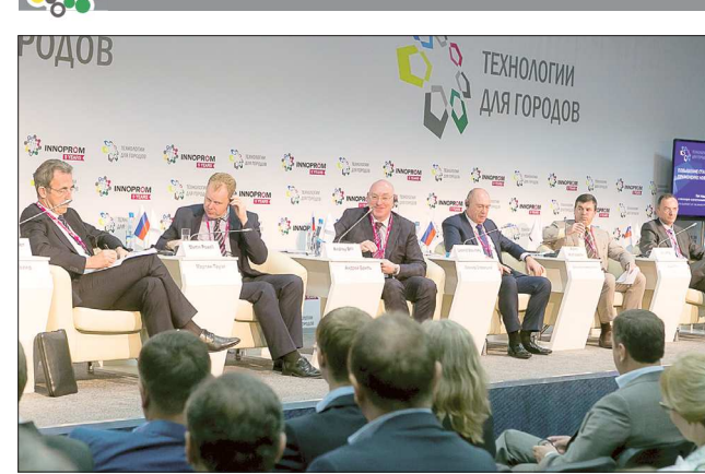
В прошлом году в ходе форума «Технологии для городов» прошло около 20 различных мероприятий