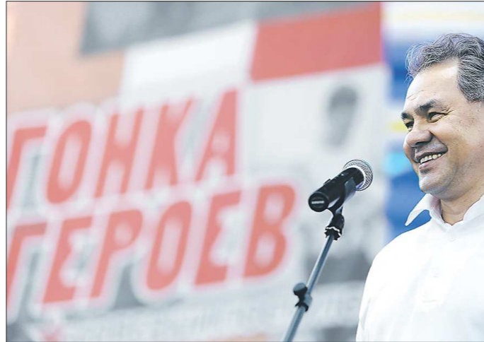
«Гонка героев» проводится при поддержке Министерства обороны РФ. Неслучайно старт третьему сезону проекта дал глава этого ведомства Сергей Шойгу. 25 апреля он открыл забег на подмосковном полигоне Алабино

повой зачёты — участники побегут командами, а точнее, взводами по двадцать человек. — Старты в регионах мы