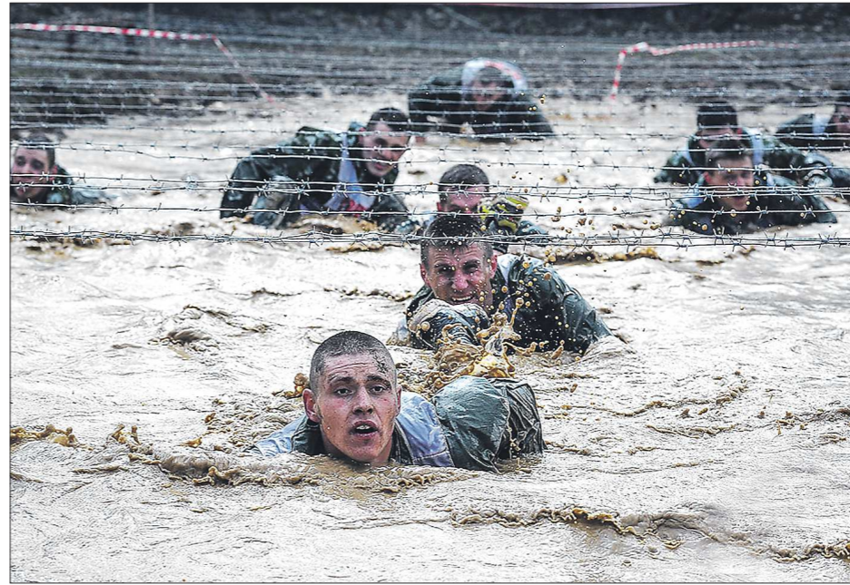
«Грязевые ванны» и колючая проволока — одни из классических помех на пути к финишу