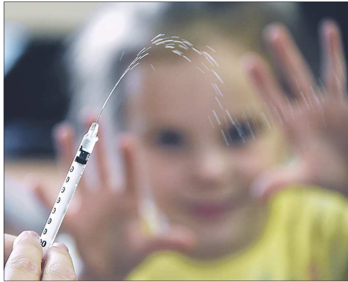
Многие родители опасаются делать детям прививки. Но, пожалуй, ещё больше тех, кто боится отпускать своих чад в одну группу с непривитыми

Сегодня прививочная кампания в России, как и во всем мире, поставлена на поток. Во всех странах есть национальный календарь профилактических прививок. Согласно российскому, первую прививку детям ставят уже в первые 24 часа жизни. В первый год ребенка ожидает почти 16 уколов с вакцинами. И очень часто организм даже здорового ребенка выдает на прививку какую-нибудь реакцию — болезненные ощущения в месте укола, высокую температуру или общее недомогание.