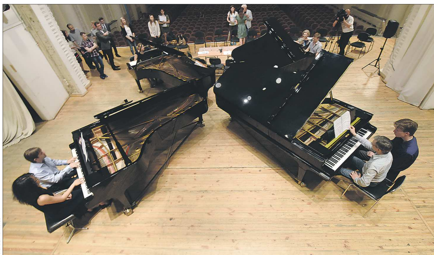
Генеральная репетиция. Музыканты исполняют «Турецкую рапсодию» (на тему «Турецкого марша» Моцарта) в 16 рук. На четырёх фортепиано

Вчера в Екатеринбурге после 15-летнего перерыва возобновился Фестиваль фортепианных дуэтов