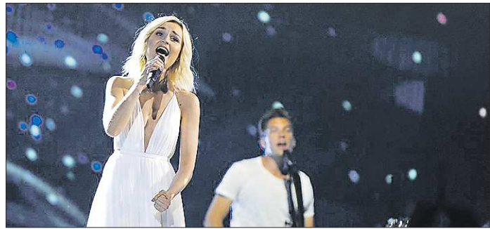
Полина Гагарина 28 лет. Она родилась в Москве, но в детстве долго жила в Греции (певица свободно говорит по-гречески)