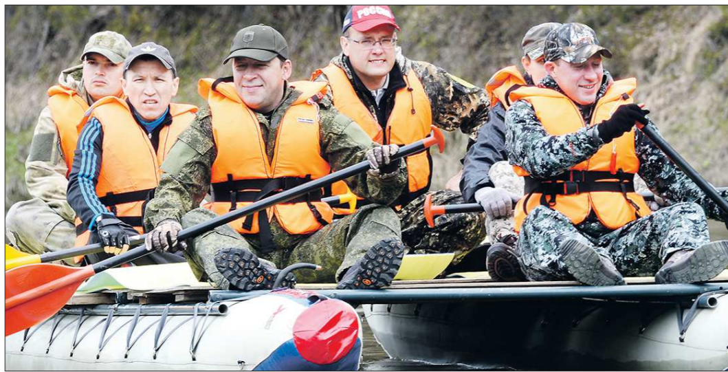
Сплав возглавили Евгений Куйвашев (слева на переднем плане) и Игорь Холманских (справа)

По весенней полноводной Чусовой сплавились в минувшую субботу, 23 мая, губернатор Свердловской области Евгений Куйвашев и полпред Президента РФ в УрФО Игорь Холманских. Конечно, не только ради прогулки они проехали больше двухсот километров от Екатеринбурга до деревни Усть-Утка. Прямо на берегу реки руководители встретились с лидерами всероссийского движения «В защиту человека труда» и обсудили проблемы и перспективы туризма на Урале.