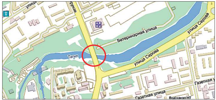
Мост по ул. Фрунзе связывает центр Нижнего Тагила с рабочими районами Выш. ВМЗ и кирпичного посёлка. Отсюда начинается путь из города на север области