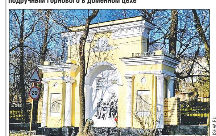
Памятник кушвинским металлургам, погибшим в Великую Отечественную войну, получил вторую жизнь.

В год юбилея Победы памятник кушвинским металлургам, погибшим в Великую Отечественную войну, получил вторую жизнь. На восстановление комплекса из областного бюджета было выделено 1,3 миллиона рублей. Примечательна архитектура мемориала, построенного в 1970 году. Обычно в честь воинов-героев тогда устанавливались стелы, а работники кушвинского завода решили создать памятник-арку. Источником вдохновения стала старинная архитектура города. Когда-то рядом стоял величественный храм, один из входов которого имел форму точно такой же арки. Храм был взорван в 1930-е годы, но святое место не пришло в запустение. Памятник обновлён, установлена красивая ограда, разбит сквер. Мемориал каждый день напоминает рабочим, идущим на смену, о подвиге земляков. Список заводчан, сложивших головы на фронтах, начинает Герой Советского Союза Николай Фоминих, работавший до войны подручным горнового в доменном цехе.