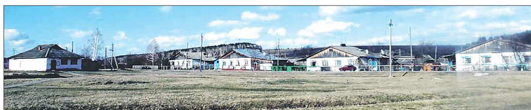
На память от некогда работавшего совхоза остались только дома по улице Молодёжной — жильё давали молодым работникам предприятия