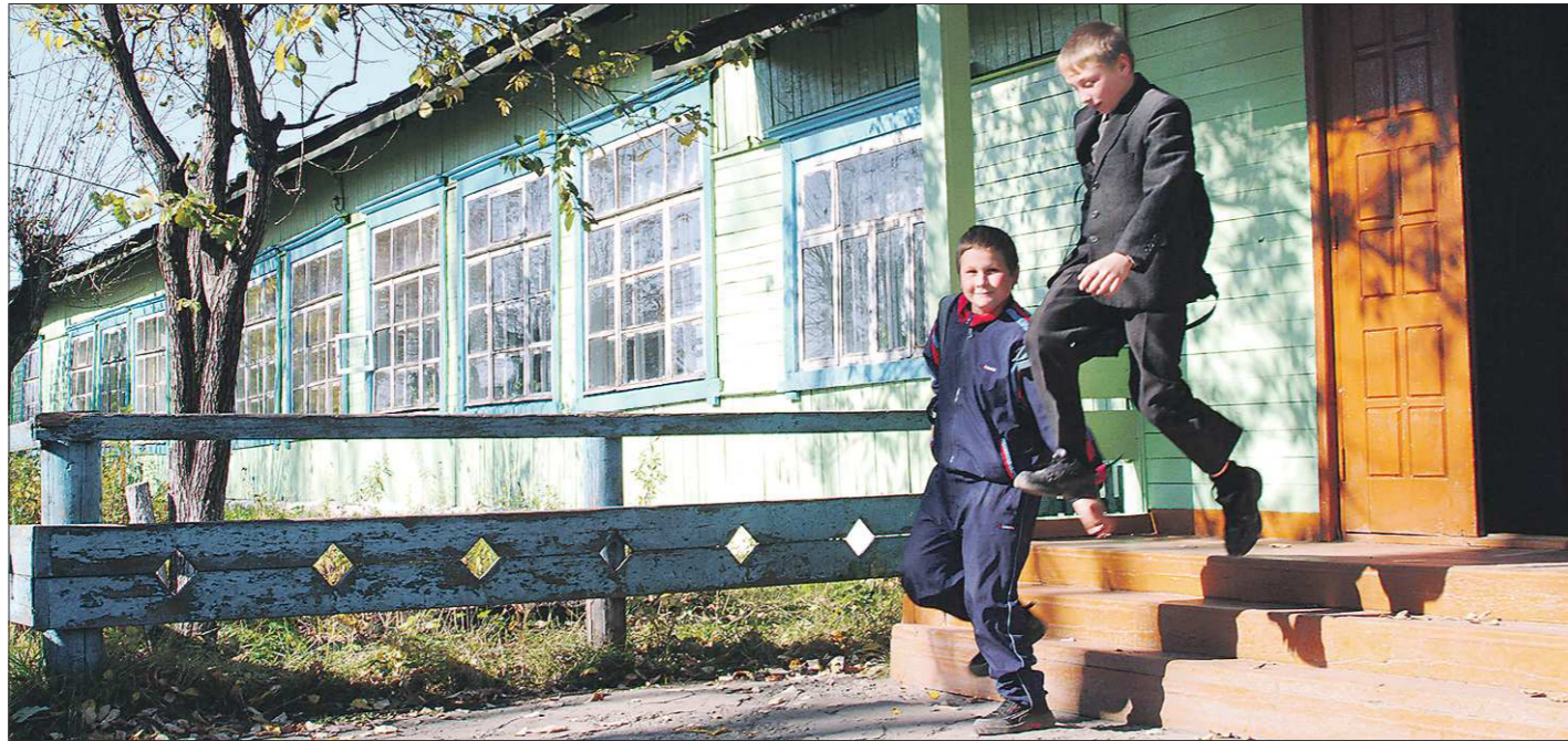
Больше всего малокомплектных школ — 140 — в Восточном управленческом округе области

Несмотря на тенденцию, в Свердловской области несколько муниципалитетов отчаянно сражаются за сохранение школ на селе — пусть даже для десятка детей. Так, например, в Красноуфимском округе насчитывается 23 малокомплектных образовательных учреждения — это 60 процентов всех школ в муниципалитете. Такой особенностью округа обязан не только своей протяжен-