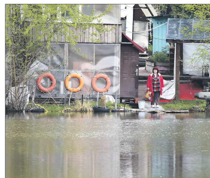
В Ревде хозяева прибрежных участков готовы к капризам природы — даже запаслись спасательными кругами

— Единая диспетчерская служба контролирует сброс