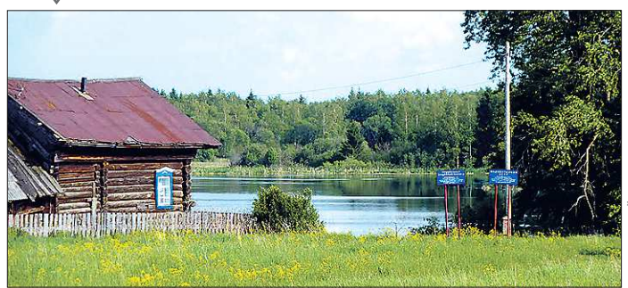
Красноуфимский посёлок Лебяжье расположился на берегу одноимённого озера