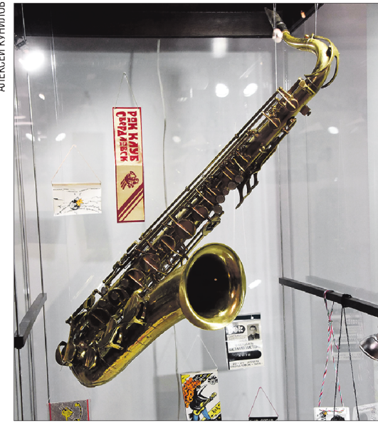
Это знаменитый саксофон Алексея Могилевского. Именно из него были «выдуты» «Последнее письмо» и «Казанова» «Наутилусов»