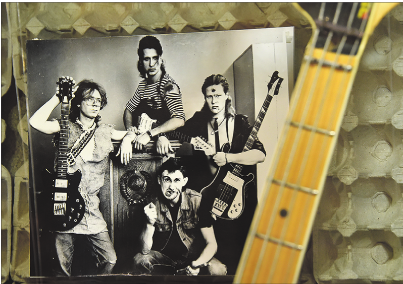
Студийные репетиционные комнаты в те времена наши музыканты оборудовали сами. Особой популярностью в качестве звукоизоляционного материала пользовались картонные упаковки из-под яиц (на фото, прикрепленном к упаковке, — группа «КРАХ»)