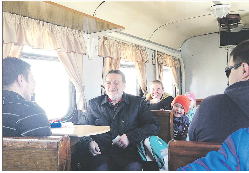
В вагоне 36 мест, во время нашей поездки они были заняты пенсионерами, ехавшими в сады, и жителями Алапаевска, отправляющимися с детьми на экскурсию в Верхнюю Синячиху