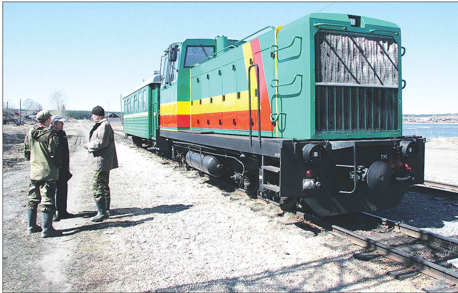
Станция Верхняя Синячиха расположена в живописном месте на берегу реки. Хочется погулять здесь дольше 10 минут, в течение которых длится стоянка поезда

Алапаевская узкоколейная железная дорога (АУЖД) — один из тех объектов, на которые делают ставку в развитии внутреннего туризма. В прошлом году за счёт областного бюджета купили современные локомотив и вагоны, в новое здание переехал музей АУЖД, в городе появились указатели, ведущие к вокзалу. Несмотря на это, до недавнего времени дорога для массового туриста была закрыта. Обычный поезд для него не подходил. Четыре раза в неделю он отправляется из Алапаевска в 19:30, в 01:10 приезжает в Санкино и сразу же едет назад. Время стоянок на промежуточных станциях — минуты. Получается, что вы просто потратите в поезде больше пяти часов, а выйдя ночью на конечной станции, не сможете даже остановиться на ночлег — никакой гостиницы в посёлке нет. Как шутит проводница, «на вокзал, ежеле, ежеле, поспать». Три раза в неделю ходит второстепенный поезд из Санкино до самой дальней станции узкоколейки — Калача — и обратно, его расписание подстроено под основную и тоже ночное. Получается, что специальный поезд до Верхней Синячихи — это выход. Тем более что идёт он час, а проезд стоит всего 26 рублей. Но не всё так просто.