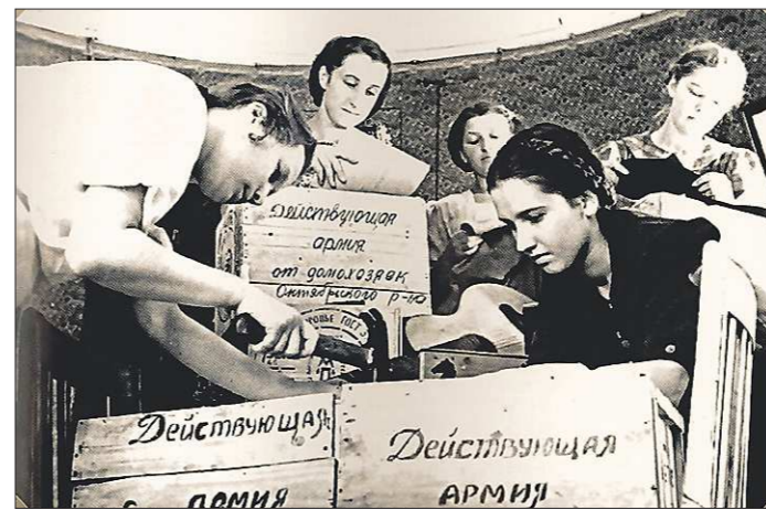
Девушки в тылу собирают посылки на фронт