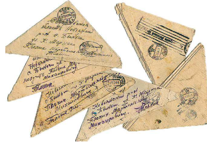
В семье Пlochих бережно хранятся те самые письма-треугольники, которые дедушка и дядя отправляли с фронта

Завтра, в День Победы, в центре посёлка установят палатку, где этот фотопроjekt презентуют жителям.