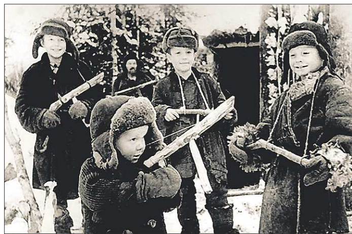
Даже в годы войны мальчишки играли в «войнушку», в ход шли автоматы из палок и сучков