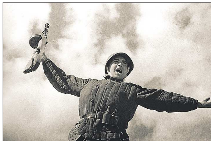
Советский боец устремляется в бой. В руках у него пистолет-пулемёт Шпагина (ППШ)