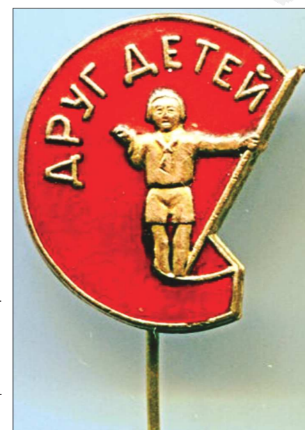
Сохранилось множество атрибутов деятельности общества «Друг детей». Например, вот такие значки