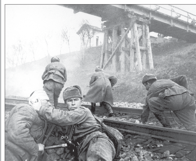
Сегодня в одном из залов ожидания железнодорожного вокзала в Екатеринбурге открывается фотовыставка «Встречи и расставания» – совместный проект Информационного агентства ТАСС и ОАО «РЖД». В экспозицию вошли архивные фотографии ТАСС 1941–1945 годов, которые широкая публика увидит впервые. Это уникальные кадры легендарных фронтовых фотокорреспондентов, таких как Евгений Халдей, Марк Редькин, Николай Ситников, Эммануил Евзерихин и многих других. Вокзалы, воинские шезлонги, станции и полустанки военной поры, запечатлённые на фото – символические места встреч и расставаний, изменившие судьбу тысяч людей.