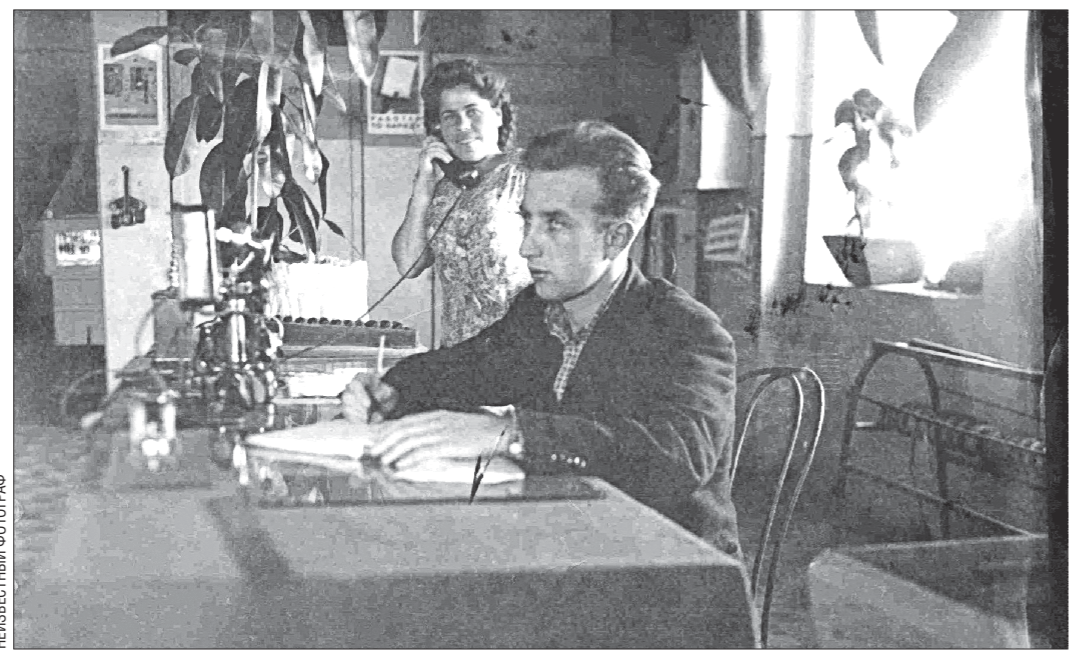
Из такой диспетчерской в годы войны руководили энергоснабжением целых регионов

(Предыдущие части опубликованы в номерах за 28 и 29 апреля).