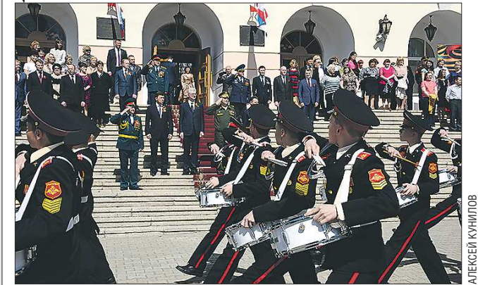
После митинга суворовцы прошли перед его участниками торжественным маршем. Колонну возглавила рота юных барабанщиков, которой 9 мая предстоит открыть парад войск Екатеринбургского гарнизона на площади 1905 года

Вчера же, 5 мая, губернатор Евгений Куйвашев и полпред Президента России в УрФО Игорь Холманских посетили Екатеринбургское суворовское военное училище (СВУ), где приняли участие в митинге, посвящённом 70-летию Победы в Великой Отечественной войне.