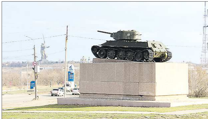
...и в 2015-м