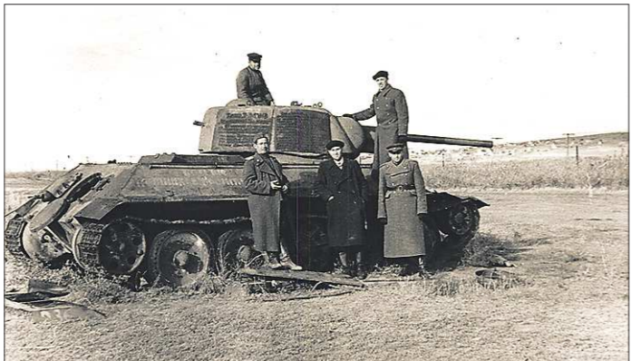
Тот самый танк Т-34 на Мамаевом кургане в 1946 году...

Едва ли не каждый шалинец знает, что в Волгограде на Мамаевом кургане стоит танк Т-34, на котором механиком-водителем воевал их земляк. Сама боевая машина попала на постамент не случайно.