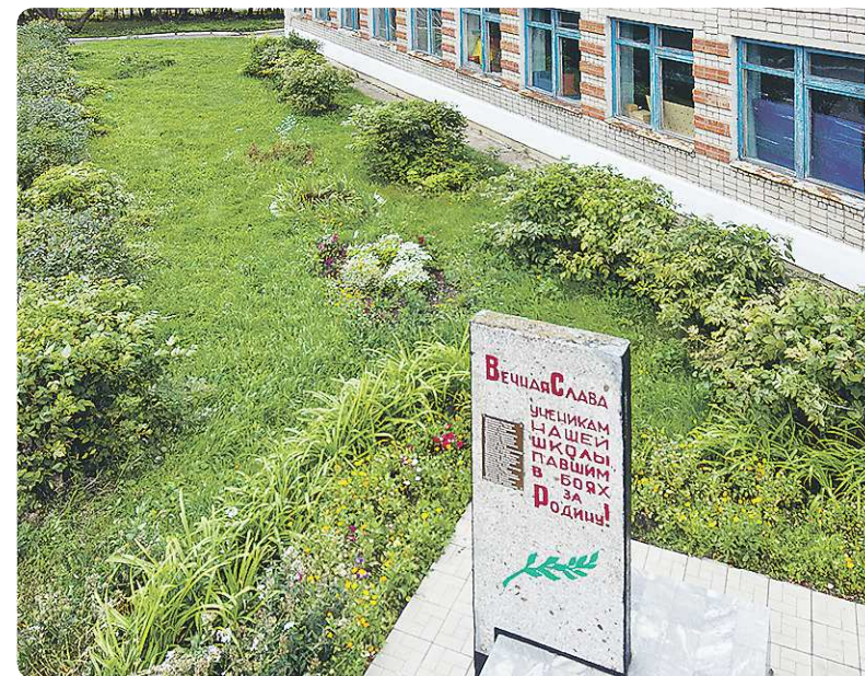
Ученики красноуральской школы №2 сами ухаживают за памятником, установленным в честь их прадедов, павших в боях за Родину