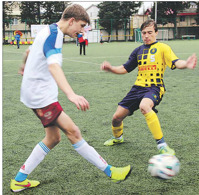
Вне соревнований уральские футболисты (в бело-синей форме) общались и даже подружились со всеми соперниками. Но в играх не щадили...