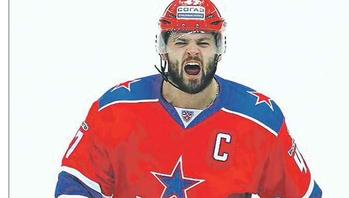
Также во второй раз Александр Радулов признан в этом году самым ценным игроком регулярного чемпионата КХЛ

ГОСУДАРСТВЕННОЕ БЮДЖЕТНОЕ УЧРЕЖДЕНИЕ СВЕРДЛОВСКОЙ ОБЛАСТИ «РЕДАКЦИЯ ГАЗЕТЫ "ОБЛАСТНАЯ ГАЗЕТА"». ОБЩЕСТВЕННО-ПОЛИТИЧЕСКОЕ ИЗДАНИЕ