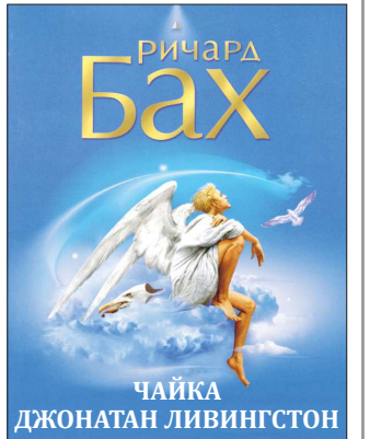
Чайка ДЖОНАТАН ЛИВИНГСТОН