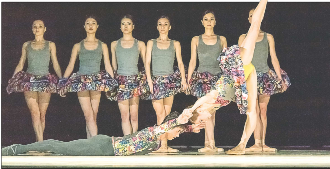
В Екатеринбурге спектакль «Цветоделика» имеет ошеломительный успех. Но ближайшие месяцы билетов на него уже нет

В финал также вышли сразу два спектакля нашего Театра оперы и балета – это опера «Летучий голландец», а также балет «Цветоделика».